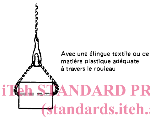
FIGURE 2 – Méthode admise de levage

https://standards.iteh.ai/catalog/standards/sist/180f25f3-6c29-4629-a153-dd08df4cb99b/iso-5285-1978