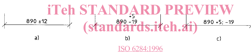
Figure 1 — Exemples d'indication d'écarts limites d'une dimension

Il convient que les écarts limites qui figurent sur les dessins soient indiqués conformément à l'exemple donné à la figure 1 a) pour un écart limite réparti symétriquement et conformément à la figure 1 b) ou à la figure 1 c) pour un écart limite réparti asymétriquement.