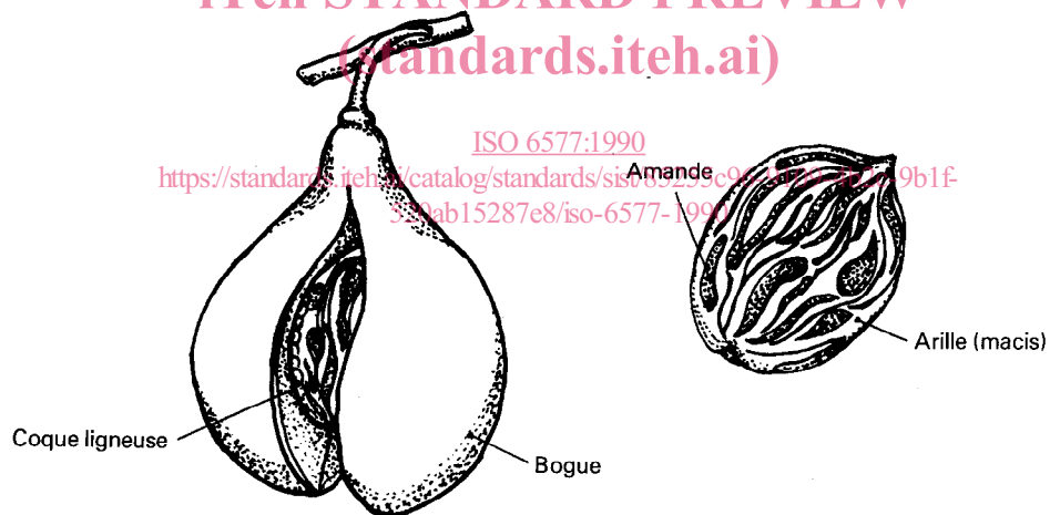
Figure 2 — Muscade - Explication schématique des différentes parties du fruit

iTeh STANDARD PREVIEW (standards.iteh.ai)