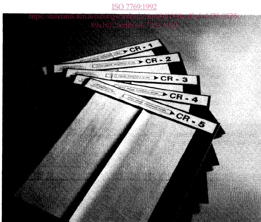
Figure 3 — Étalons de plis AATCC