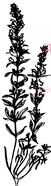
Figure 2 — Sarriette des montagnes (rameau)