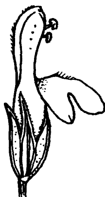
Figure 1 — Sarriette des montagnes (fleur)