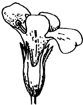
Figure 1 — Sarriette des jardins (fleur)