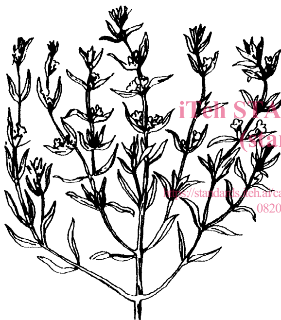
Figure 2 — Sarriette des jardins (rameau)