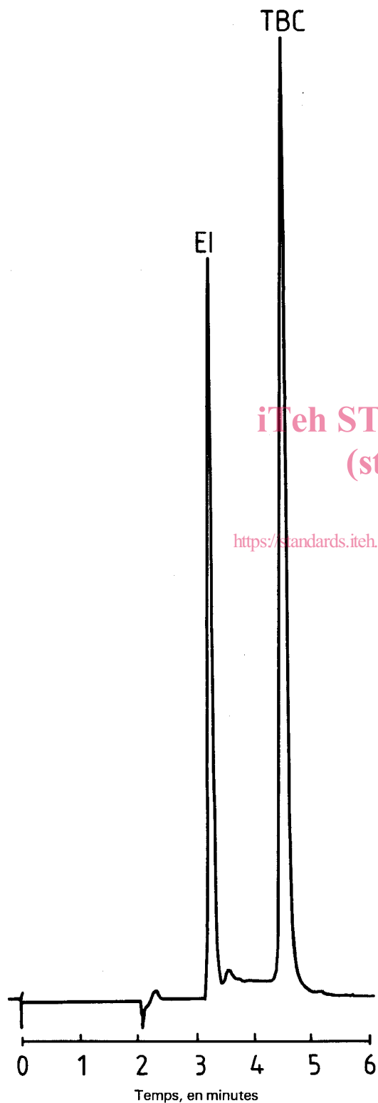
Figure 1 — Solution étalon contenant, par litre, 200 mg de TBC et 28 mg de m -nitrophénol (étalon interne)

(Cette annexe ne fait pas partie intégrante de la norme.)