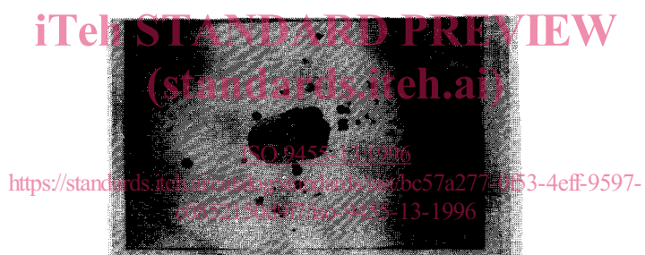
Formation de projections de flux