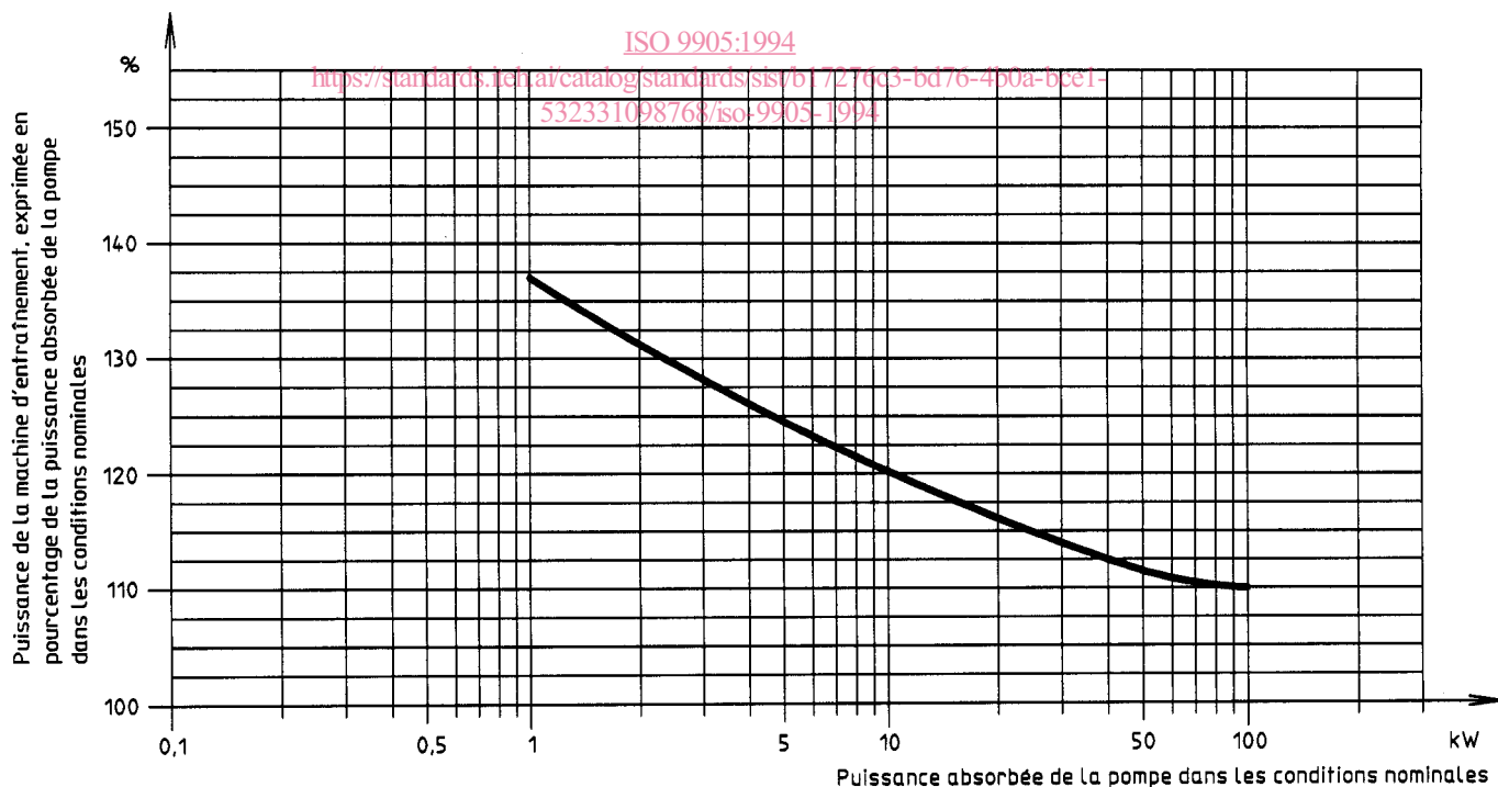
Figure 1 — Puissance de la machine d'entraînement, exprimée en pourcentage de la puissance nominale absorbée de la pompe entre 1 kW et 100 kW