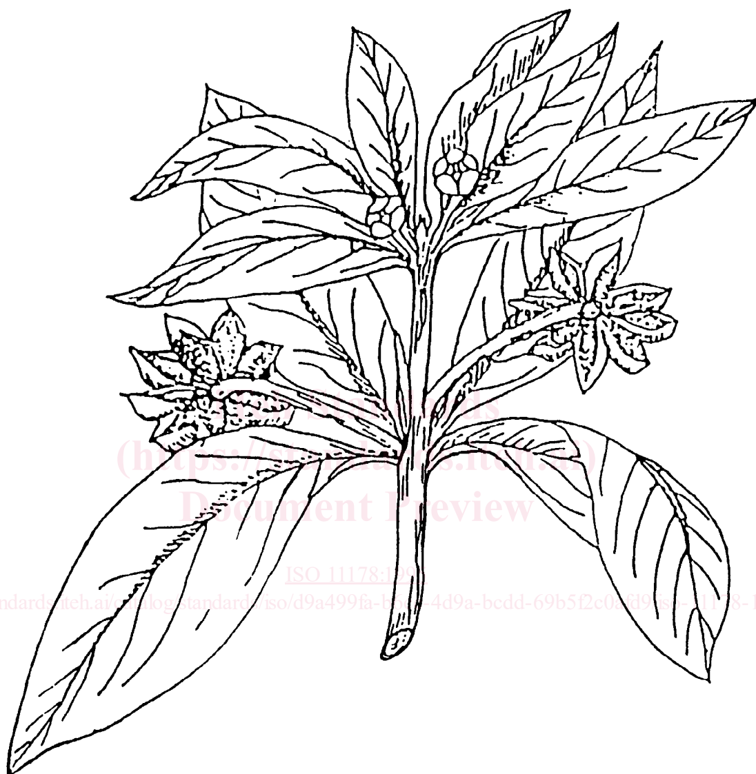
Figure 1 — Rameau de badianier avec fruit et fleur