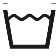
Slika 1: Pranje, splošno (uporaba ISO 7000 – 3085)

Postopki pranja so označeni s simbolom kadi, kot prikazuje slika 1.