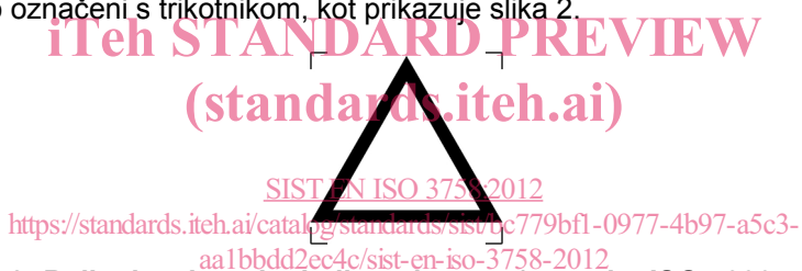
Slika 2: Beljenje s katerim koli sredstvom (uporaba ISO 7000 – 3098)

Postopki beljenja so označeni s trikotnikom, kot prikazuje slika 2.