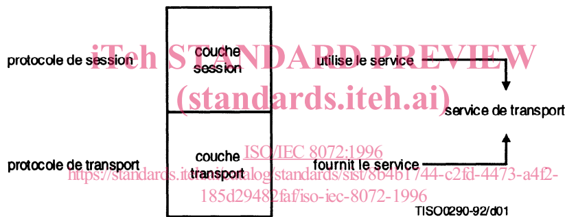
Figure Intro. 1 – Relation entre le service de transport et les protocoles OSI de transport et de session

La présente Recommandation | Norme internationale définit le service fourni par la couche transport à la couche session, à la frontière entre les couches session et transport du modèle de référence. Elle fournit aux concepteurs de protocoles de session une définition du service de transport servant de support au protocole de session, et aux concepteurs de protocoles de transport une définition des services à fournir par l'action du protocole de transport sur la couche de service sous-jacente. Cette relation est illustrée dans la Figure Intro. 1.