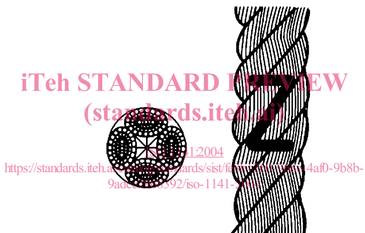
Figure 2 — Forme d'un cordage câblé à 4 torons (type B)