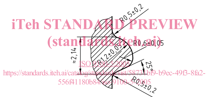
Figure 1 — Profil de la fraise