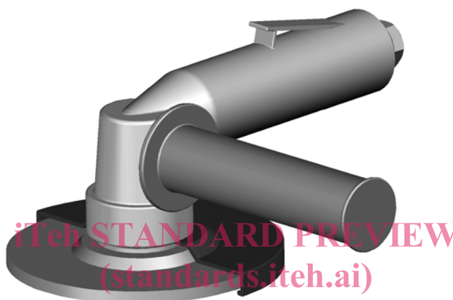
Figure 3 — Meuleuse d'angle pneumatique où le moteur sert de poignée principale