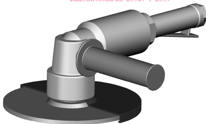
Figure 4 — Meuleuse verticale pneumatique avec poignée principale séparée