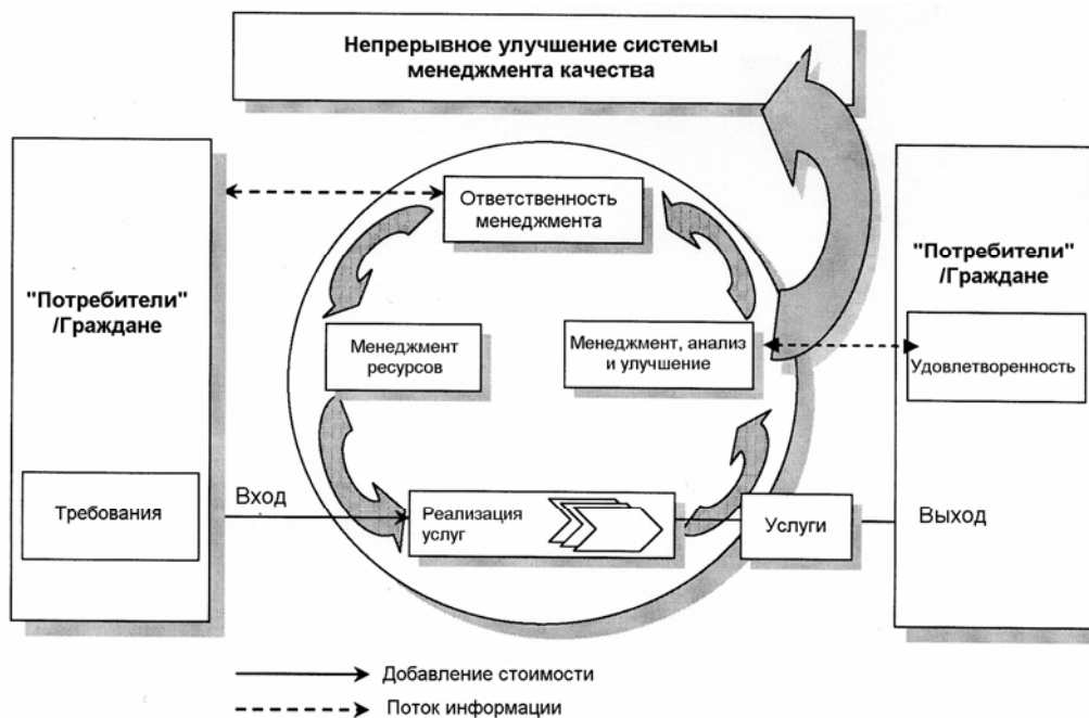
Рисунок 2 — Модель основанной на процессах системы менеджмента качества для местных органов власти