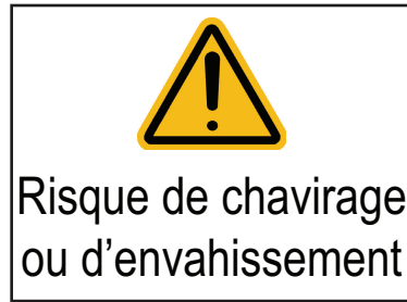
Figure Amd.1-3 — Bateau vulnérable au chavirage ou à l'envahissement (en utilisant l'ISO 7010 – W001 «Avertissement général»)