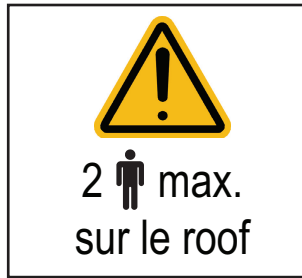
Figure Amd.1-1 — Accès limité (en utilisant l'ISO 7010 – W001 «Avertissement général»)