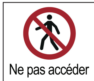
Figure 4 — Ne pas accéder (en utilisant l'ISO 7010 – P004 «Passage interdit»)

À la Figure Amd.1-1, il convient d'ajuster le nombre de personnes et l'emplacement de manière appropriée à la restriction, par exemple roof, pont avant, «flybridge».