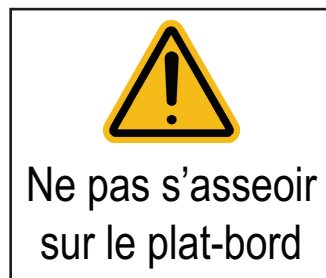
Figure Amd.1-4 — Ne pas s'asseoir sur le plat-bord (en utilisant l'ISO 7010 – W001 «Avertissement général»)

6.3.4.2 Si le bateau est envahi ou chavire sous cette charge, il doit être limité à la catégorie de conception D et une étiquette d'avertissement, comme celle donnée à la Figure Amd.1-4, doit être affichée en un endroit qui soit clairement visible en entrant dans le bateau. Cette étiquette doit avoir une dimension verticale minimale de 25 mm et être constituée d'une plaque rigide ou d'une étiquette souple fixée sur le bateau de façon qu'elle ne puisse être retirée qu'à l'aide d'outils.