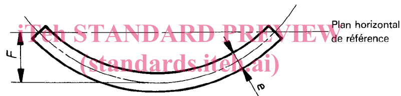
ISO 703:1988 https://standards.iteh.ai/catalog/standards/sist/13a54f09-bf1a-4b40-951b-759076cc7900/iso-703-1988 Figure 2 — Détermination de la flèche F