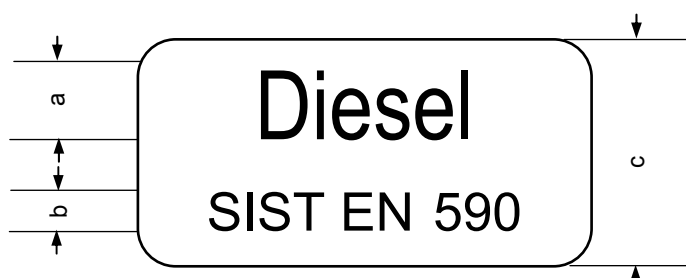
Slika NA.1: Velikost in oblika tablic (nalepk)