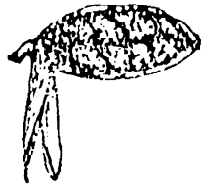
b) Présentation des graines à l'intérieur de la capsule