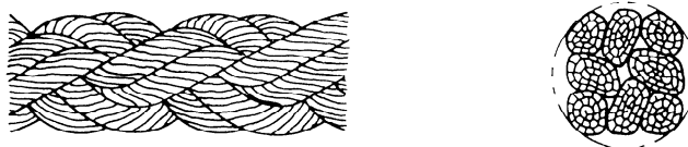
Figure 2 — Forme d'un cordage tressé à huit torons (type E)