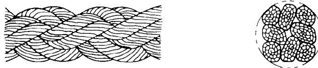
Figure 3 — Forme d'un cordage tressé à huit torons (type E)