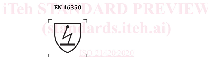
Figure 2 — Exemple de marquage relatif aux propriétés électrostatiques des gants selon l'EN 16350 et l'ISO 7000-2415

Deleted: seulement si les gants satisfont aux exigences de l'EN 16350