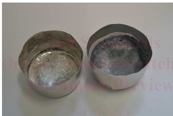
Figure 1 — Disposition du carbonate de lithium et de l'échantillon dans la capsule de fusion

https://standards.iteh.ai/catalog/standards/iso/28b607b2-00b0-42e6-aa72-0cdbf64b14bc/iso-16169-2018