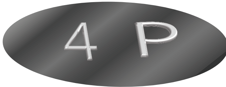
Figure 3 — Exemples de caractères tactiles

EXEMPLE Un chiffre arabe ou un simple caractère latin comme illustré à la Figure 3 .