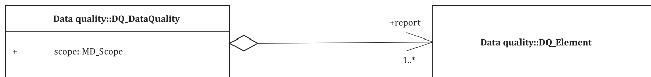
Figure 2 — Unité de qualité des données

Une unité de qualité des données est la combinaison d'un domaine d'application et d'éléments de qualité des données. La Figure 2 décrit une unité de qualité des données.