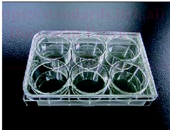
Figure 2 — Plaque en plastique à 6 puits pour la méthode des plages de lyse

Des plaques à 6 puits avec d'autres traitements de stérilisation peuvent être utilisées après validation appropriée de la croissance cellulaire. Voir la Figure 2 .