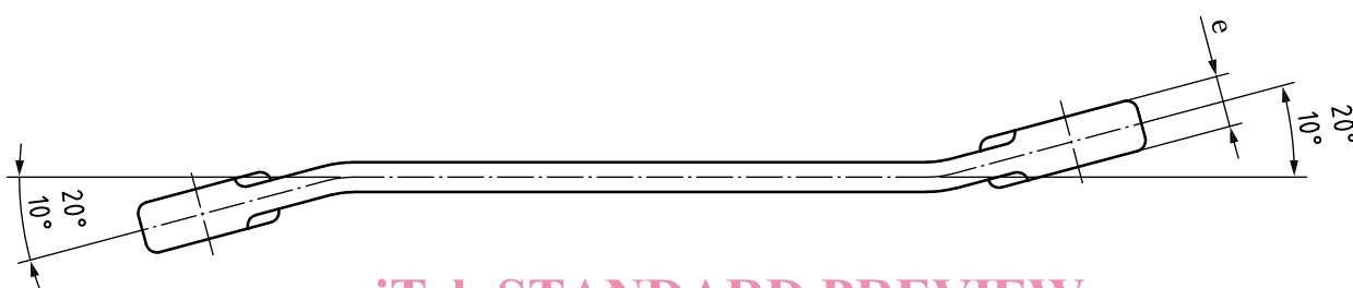
iTeh STANDARD PREVIEW (standard.iteh.ai) Forme A: inclinée