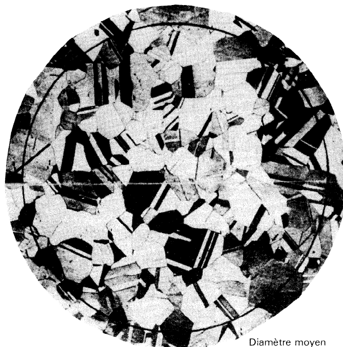
Diamètre moyen du grain 0,090 mm