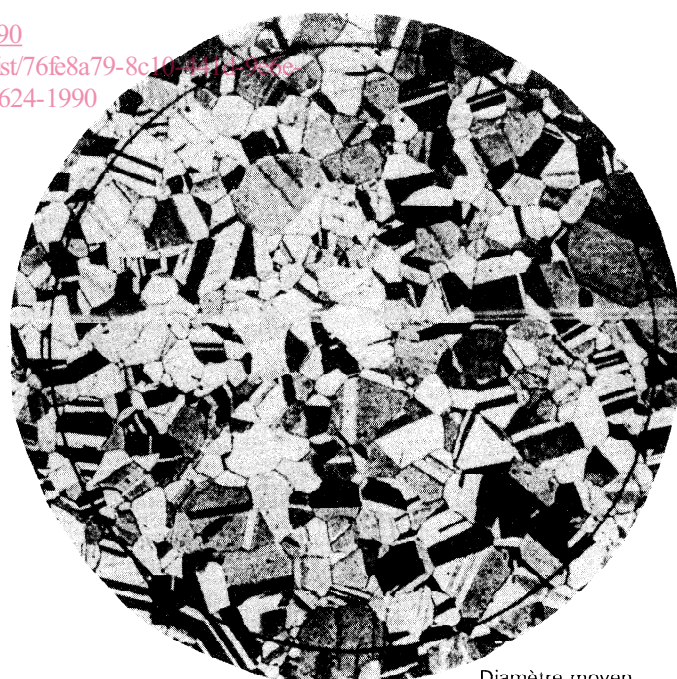
Diamètre moyen du grain 0,060 mm