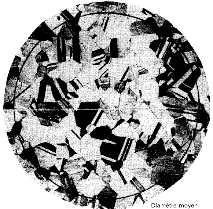
Diamètre moyen du grain 0,090 mm