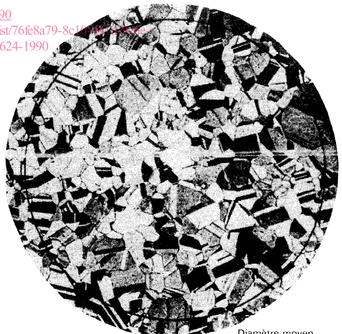
Diamètre moyen du grain 0,060 mm