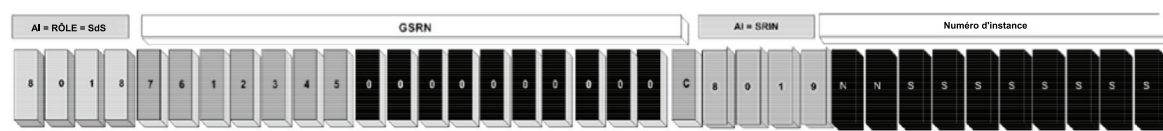
Figure 2 — Numéro d'instance de relation de service (SRIN)

Pour les besoins du présent document, et afin d'en assurer la conformité avec l'ISBT 128, le SRIN doit être utilisé sous la forme d'une chaîne de longueur fixe dont les deux premiers chiffres (NN) sont réservés au code d'emplacement ISBT 128 (Tableau RT018); la sélection des huit (8) chiffres restants est laissée à la discrétion de l'utilisateur et peut être incrémentielle.