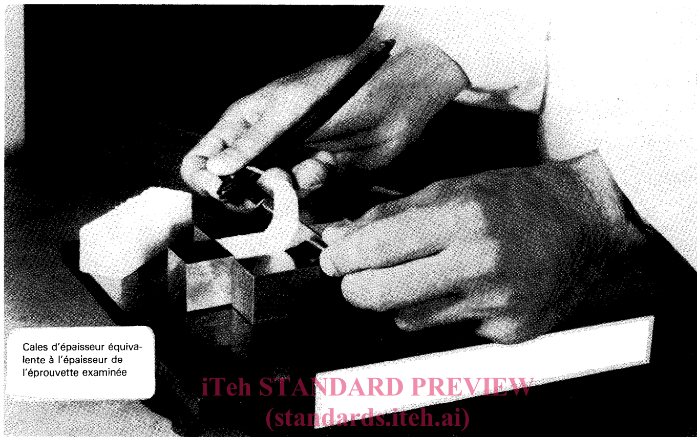
Figure 2 — Découper à lame de rasoir permettant de découper une tranche mince d'un plastique alvéolaire afin de déterminer le diamètre moyen des alvéoles http://standards.iteh.ai/catalog/standards/sist/21cc592-054d-4ec1-8827-0589f5881690/iso-2896-1987