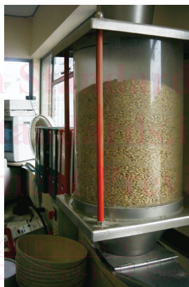
Figure 3 — Recueil d'échantillons individuels dans le cyclone, montrant la séparation de la matière fine