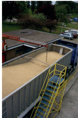
Figure 2 — Prélèvement d'échantillons dans des chargements d'orge avec un échantillonneur Samplex CS90

Chaque échantillon individuel était aspiré par la sonde de prélèvement jusqu'au laboratoire et recueilli dans un cyclone. Ce procédé entraînait une nette séparation de la matière fine et des grains pendant le prélèvement (voir la Figure 3 ).