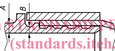
Figure B.1 — Exemples de raccords à compression

A, B, C points de mesure de l'épaisseur de paroi minimale du raccord