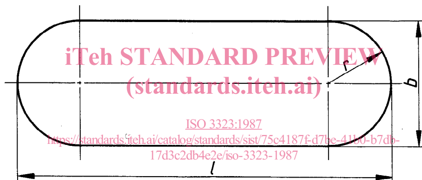
Dimensions en millimètres