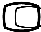
c) Cadrage horizontal (par exemple écran de télévision)