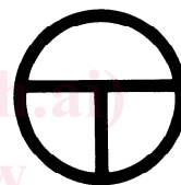
b) Marche/arrêt (bouton-poussoir)