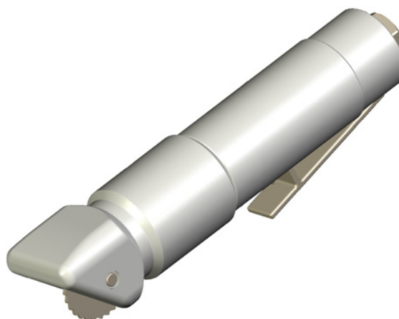
Figure 2 — Petite scie circulaire